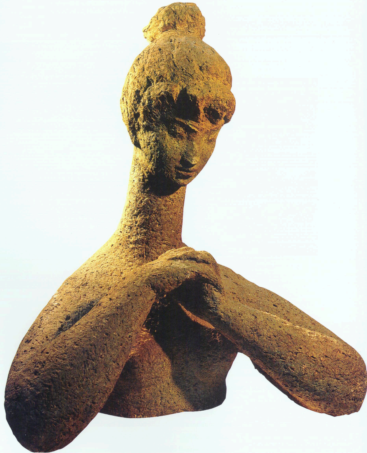
“Oyun” Rənglənmiş şamot, 1965 “A game” Coloured chamotte, 1965