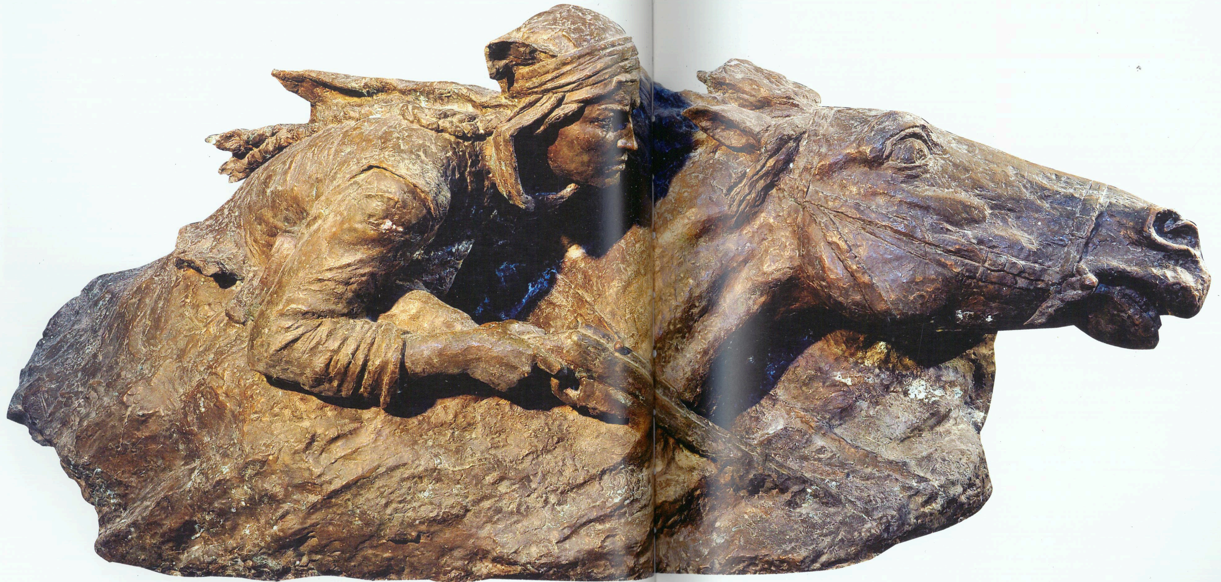
“Həcər” Tunc, 1958-59 - cu illər “Hajar” Bronze, 1958-59