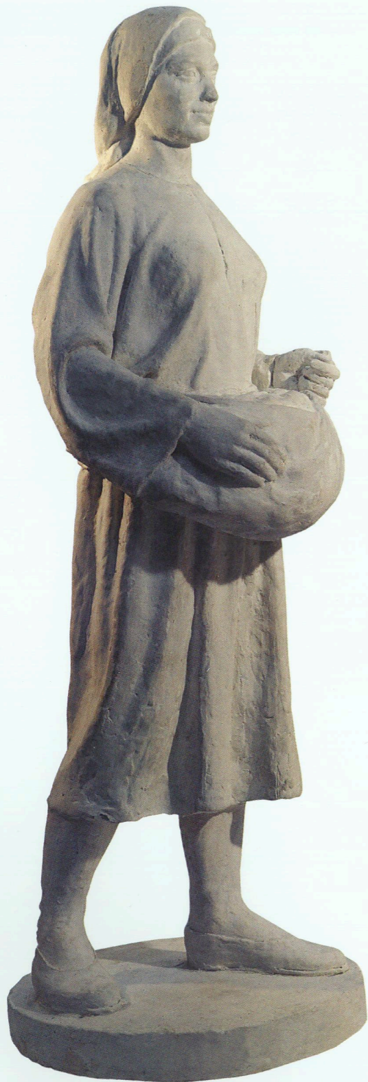
“Kolxozçu qadın” (surət) Gips, 1940 “Farmer woman” (copy) Plaster cast, 1940