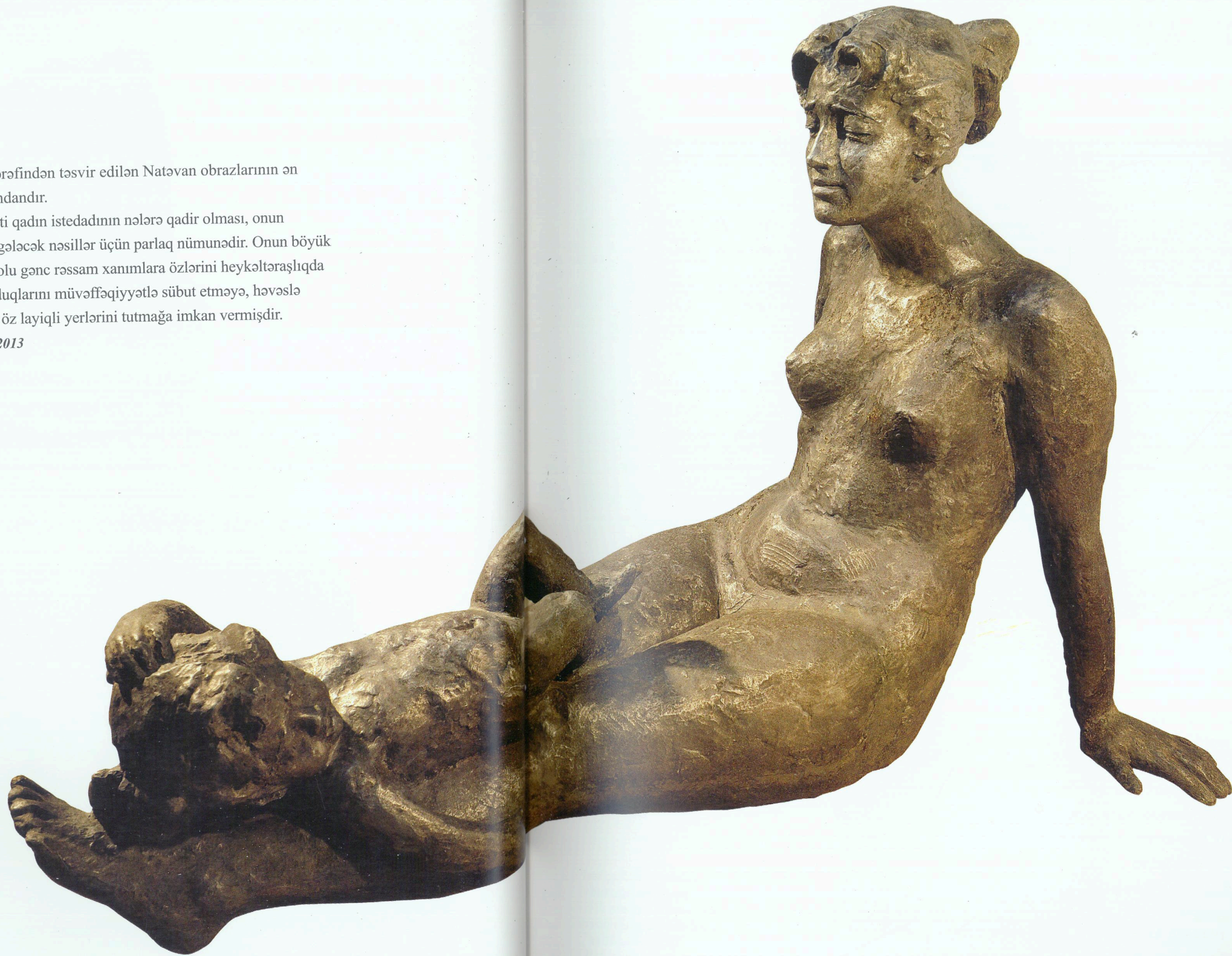
"Layla" Allümin, 1963 "Lullaby" Alumine, 1963