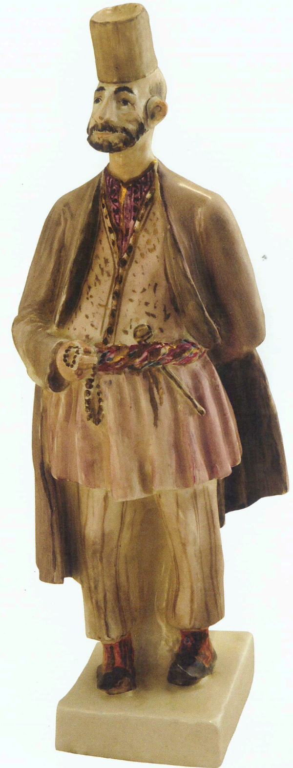
“Məşədi İbad” Dekorativ fiquru (Üzeyir Hacıbəylinin “O olmasın, bu olsun” komediyası əsasında) Çini, şirəüstü naxış, 1950-ci illər “Meshadi Ibad” Decorative figure (based on comedy by Uzeyir Hajibeyli “If not that one then this one” (“O olmasın, bu olsun”) China, ornament over syrup, 1950s