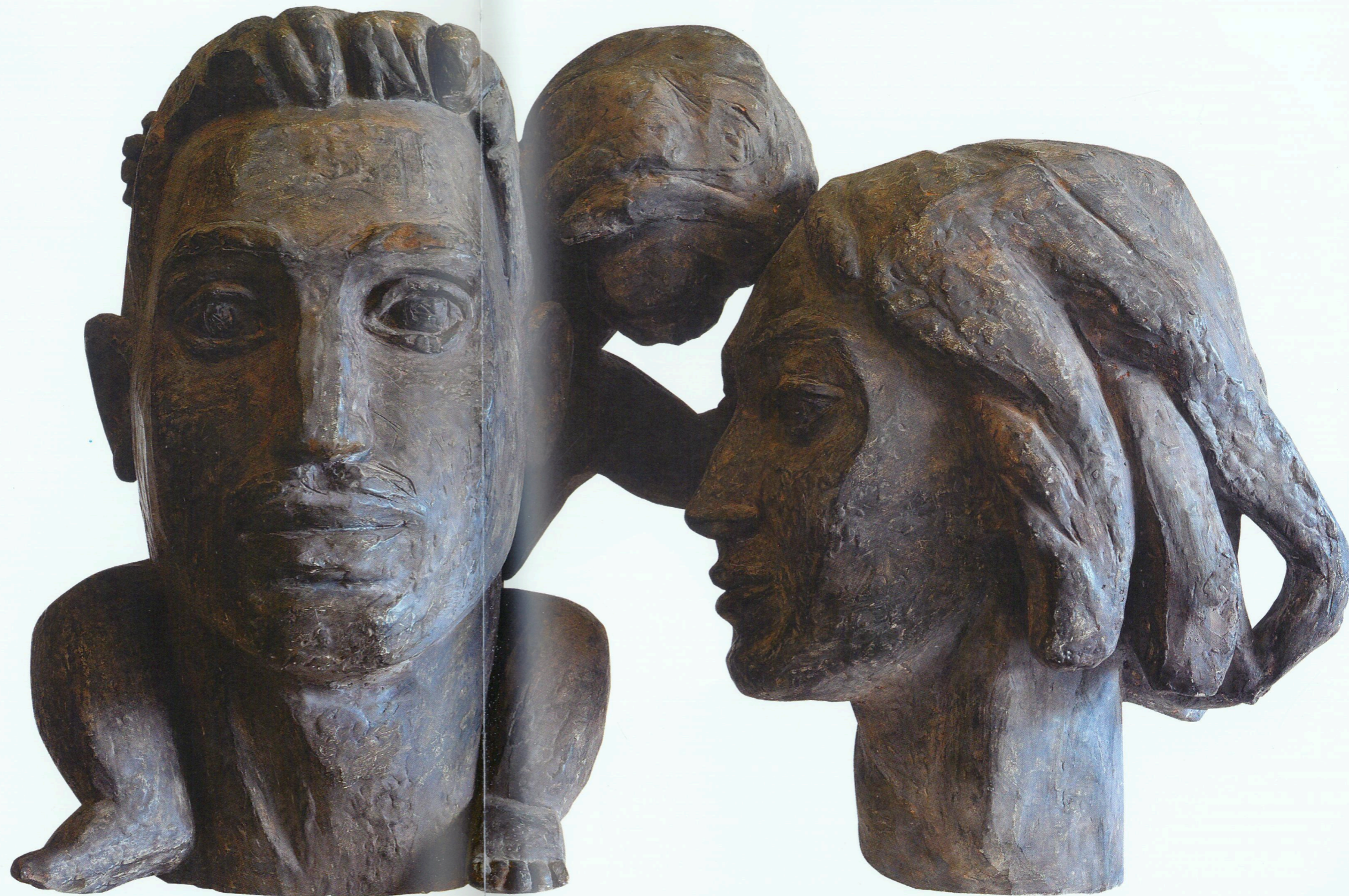
"Ails" Sement, 1966 "Family" Concrete, 1966