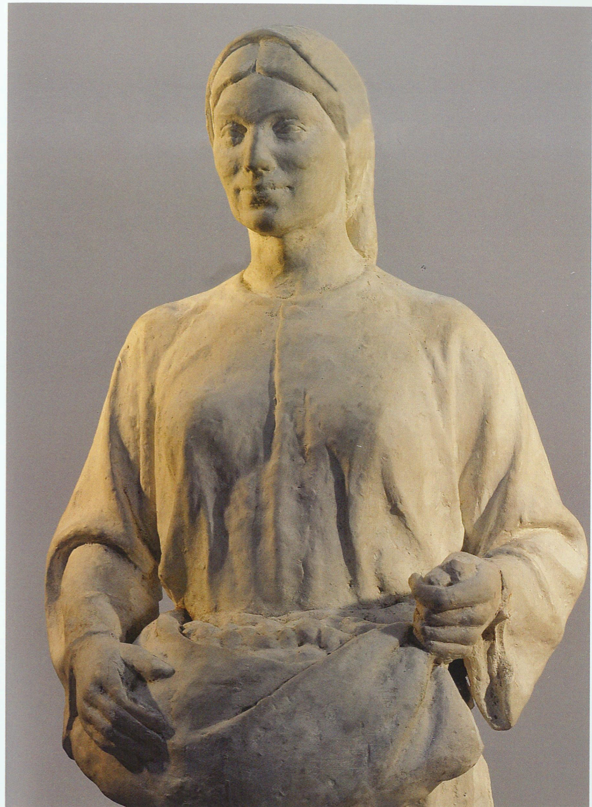
“Kolxozçu qadın” (surət) Fragment Gips, 1940 “Farmer woman” (copy) Fragment Plaster cast, 1940

Məhz bu kiçik formalı heykəltəraşlıq elementləri sənətkara öz texnikasını təkmilləşdirməyə, yeni iş üsullarını öyrənməyə, qazanılmış vərdisləri yenidən istiqamətləndirməyə və sintezləşdirməyə imkan verirdi. “Koroğlu” operasından olan rəqqasələrin fiqurları yüksək dekorativliyi və ifadəliliyi ilə diqqəti cəlb edir.