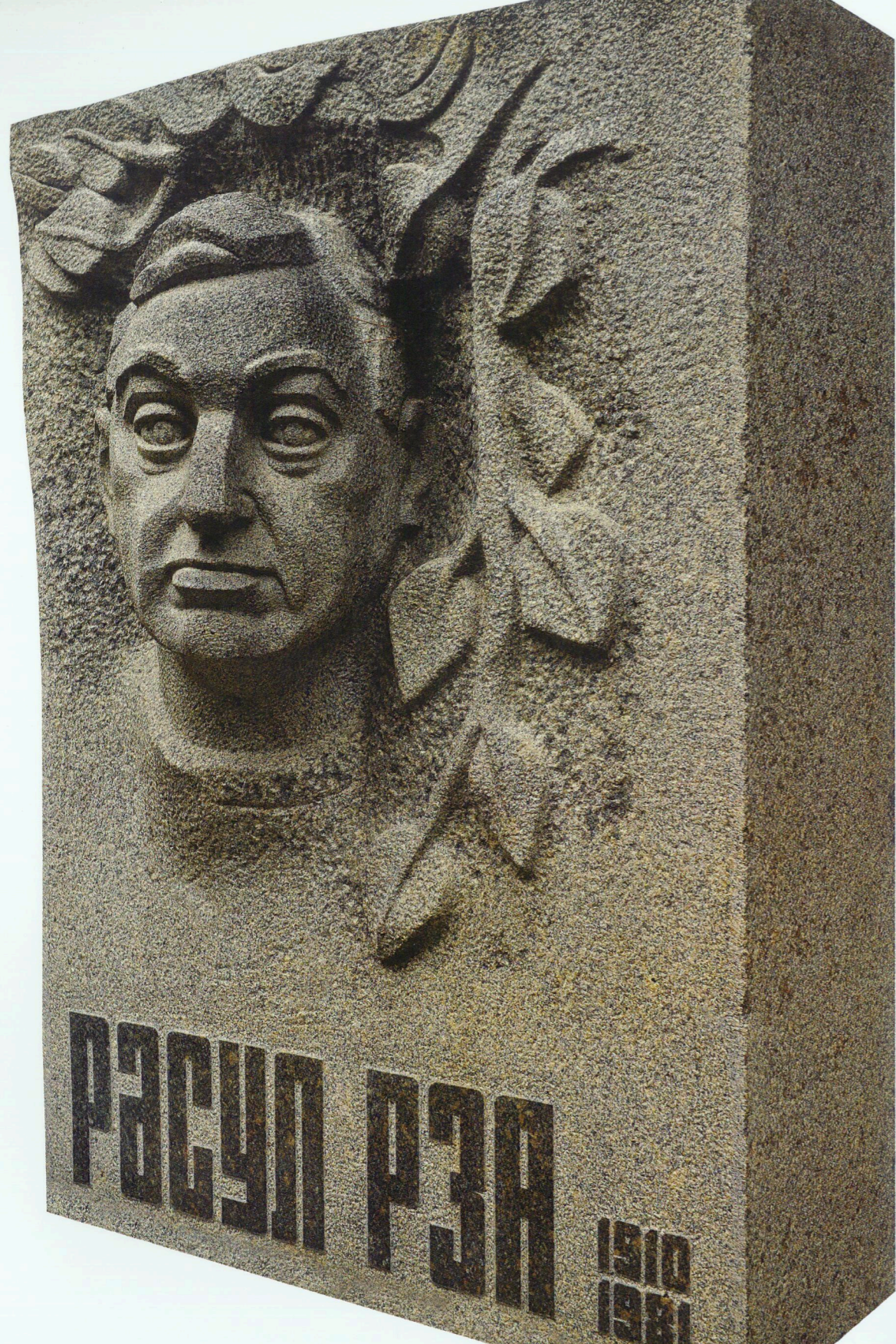
Şair Rəsul Rzanın qəbirüstü abidəsi Qranit Gravestone of poet Rasul Rza Granite