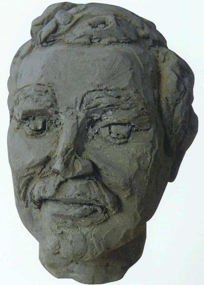
"Kişi portreti" Gil, 1970-ci illər "Portrait of a man" Clay, 1970s

and creative passion of the young artist. "Vacation of the pioneers", "Sheppard" and other works demonstrate that at this stage, the young artist put a greater emphasis on light and shade patterns, rhythmic organization of the space, the outlining elaboration of nature with remarkable sculptural symmetry. These features represent the initial stage of creativity and characterize the artist as an individual pursuing a unique way in the art within his professional development. It is worth to mention that at the turn of 20's and 30's, he productively worked in the magazine "Molla Nasreddin". Since the artist himself recalled afterwards, the meeting with the invaluable editor of the magazine, writer-publicist and honorable citizen of his motherland, J.Mammadguluzade, made an indelible impression on him.