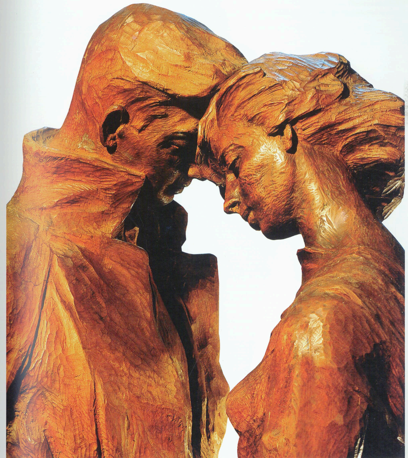
"Sevgililər" Fragment Ağac, 1960 "Lovers" Fragment Wood, 1960