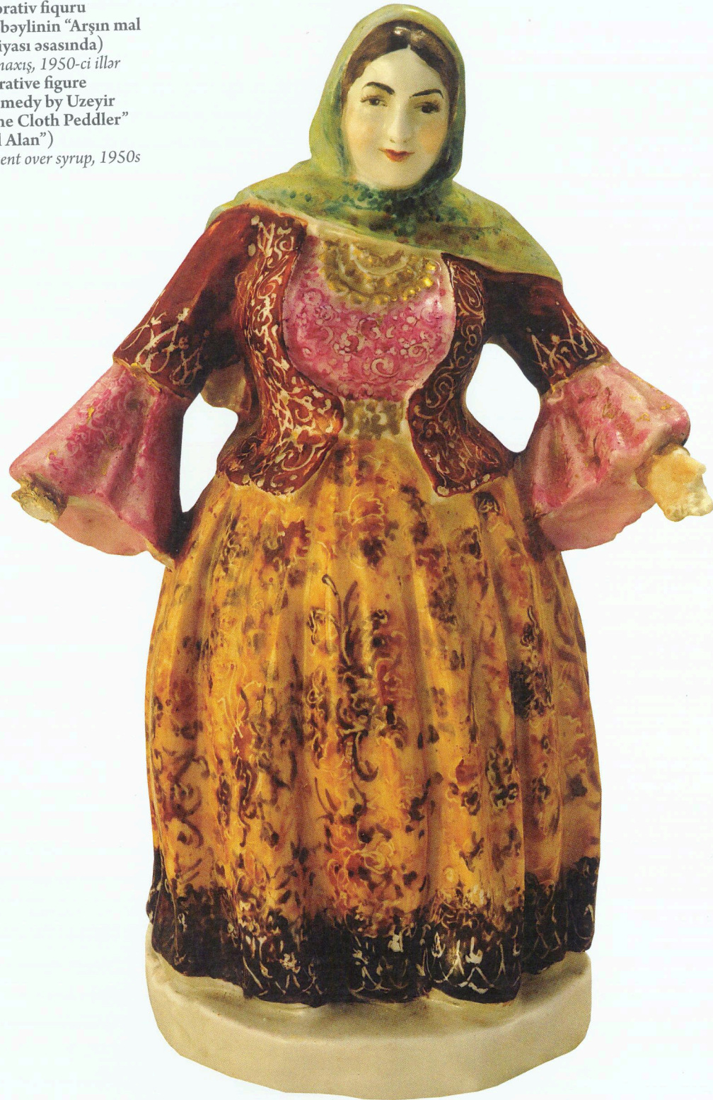
“Xala” Dekorativ fiquru (Üzeyir Hacıbəylinin “Arşın mal alan” komediyası əsasında) Çini, şirəüstü naxış, 1950-ci illər “Aunt” Decorative figure (based on comedy by Uzeyir Hajibeyli “The Cloth Peddler” (“Arshin Mal Alan”) China, ornament over syrup, 1950s