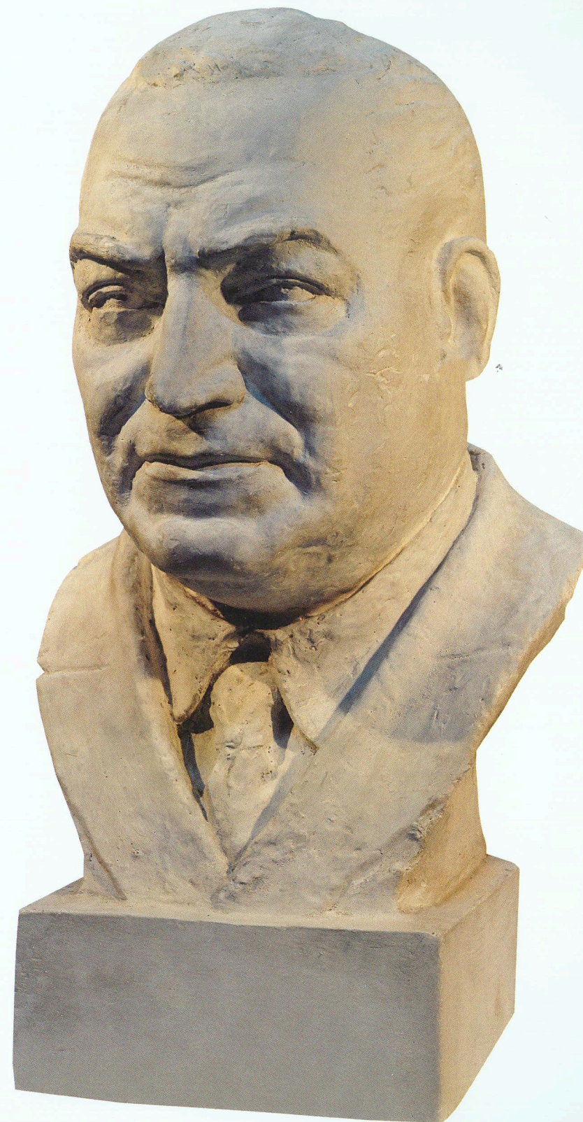
“Rəssam Əzim Əzimzadənin büstü” Gips “Bust of painter Azim Azimzade” Plaster cast

Undeniable contribution of Azerbaijan woman in the development of national culture, her role in formation and development of the fundamental professional school of sculpture in Azerbaijan, as well