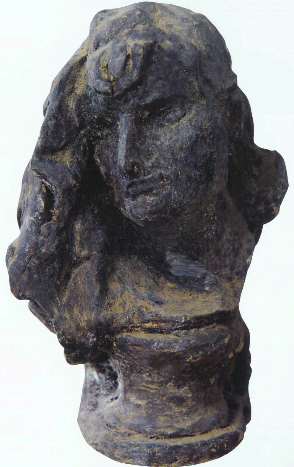
“Qadın portreti” Gil, 1950-ci illər “Portrait of a woman” Clay, 1950s