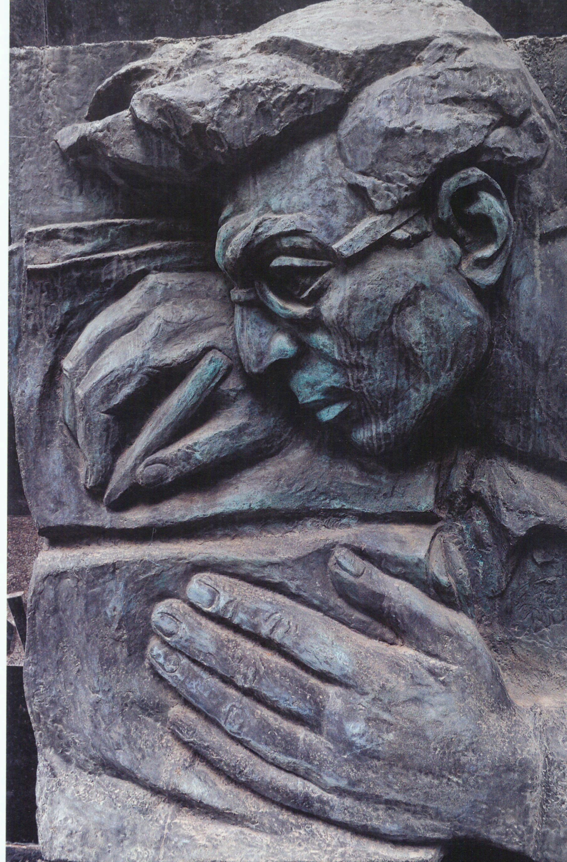
Cəfər Cabbarlının qəbirüstü abidəsi Tunc, 1970-ci illər Gravestone of Jafar Jabbarly Bronze, 1970s

In the postwar years, the creative stage of the artist associated with the art of satirical drawing, caricature with propaganda posters achieves the following drive. The artist's collaboration with the magazine "Kirpi", the loyal successor of the glorious traditions of "Molla Nasreddin", was particularly productive. Actually, I. Akhundov's collaboration with this production was not a regular customer and client correlation; the artist, along with other authors, laid the artistic image of the magazine, thus mostly determining the foundation on which postwar patriotic caricatures were developed. At this time, the works of I. Akhundov reflect the maturity of the conception and the ability to more clearly and eloquently reveal the essence of the determined task. The works of this period are deprived of unnecessary elements, and color and shape of plastic are based, on very sturdy drawing, on the most fundamental and professional tools