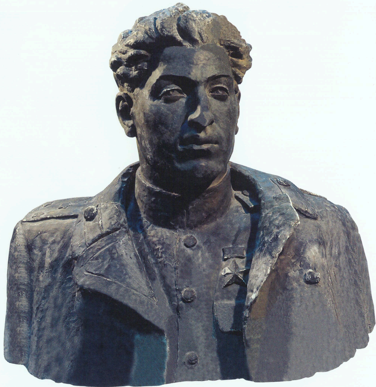
“Sovet İttifaqı Qəhrəmanı İdris Süleymanovun büstü”