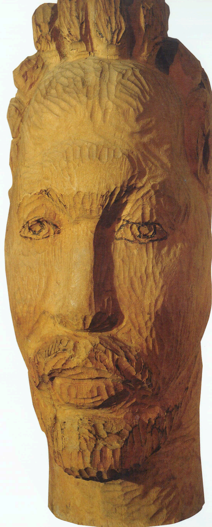
“Toğrulun portreti” Ağac, 1979 “Portrait of Togrul” Wood, 1979