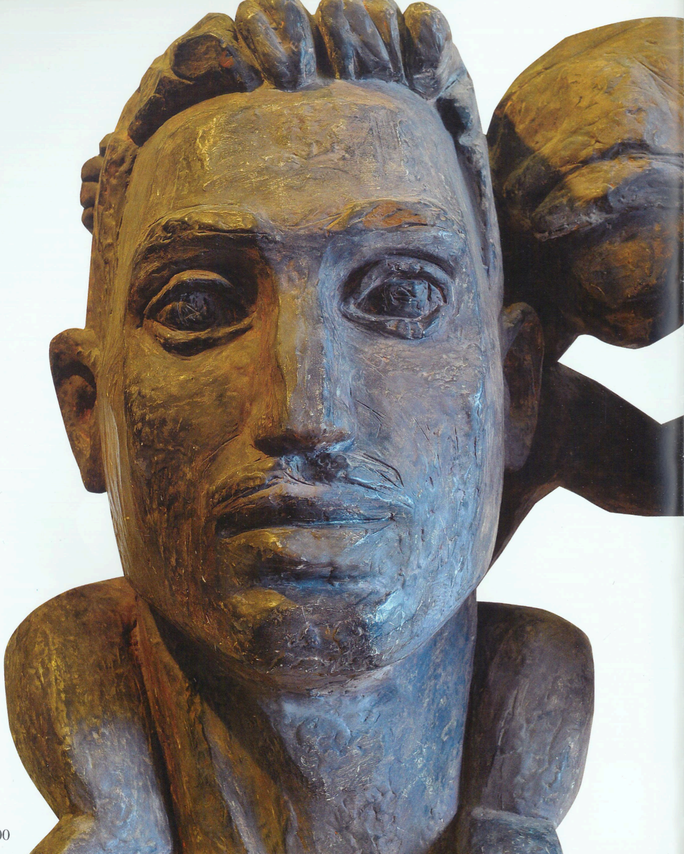
"Ailə" Fraqmentlər Sement, 1966 "Family" Fragments Concrete, 1966