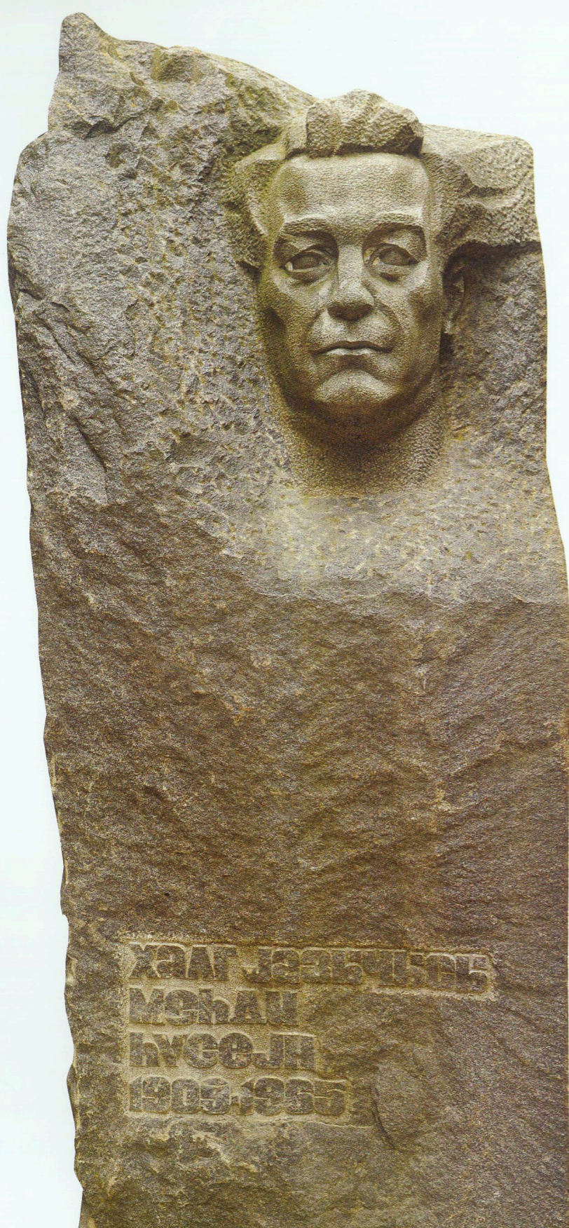
Yazıçı Mehdi Hüseynin qəbirüstü abidəsi Qranit Gravestone of writer Mehdi Huseyn Granite