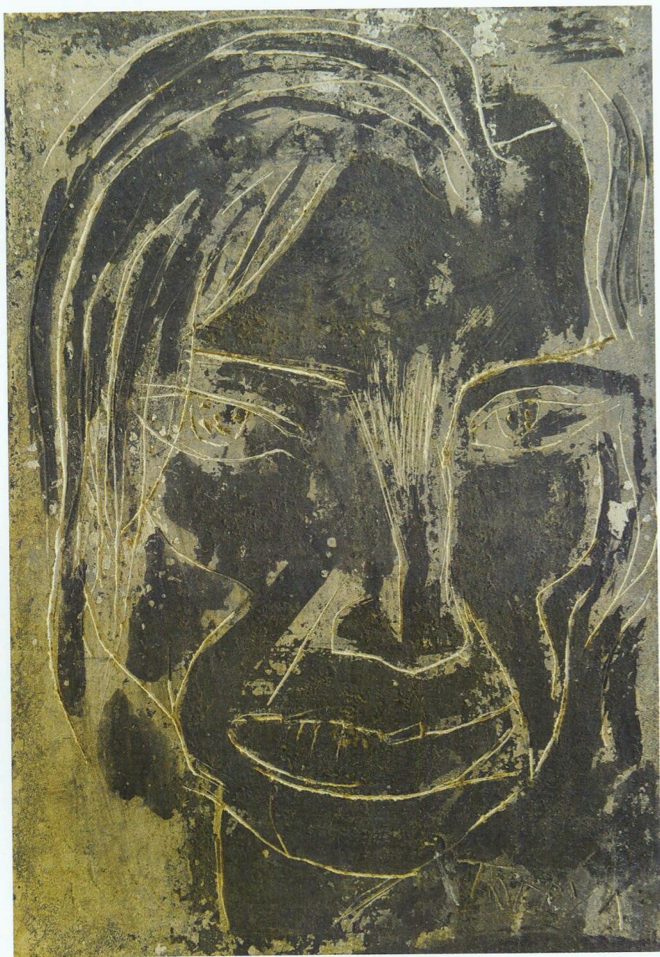
“Sattarın portreti” Gips, 1965 “Portrait of Sattar” Plaster cast, 1965