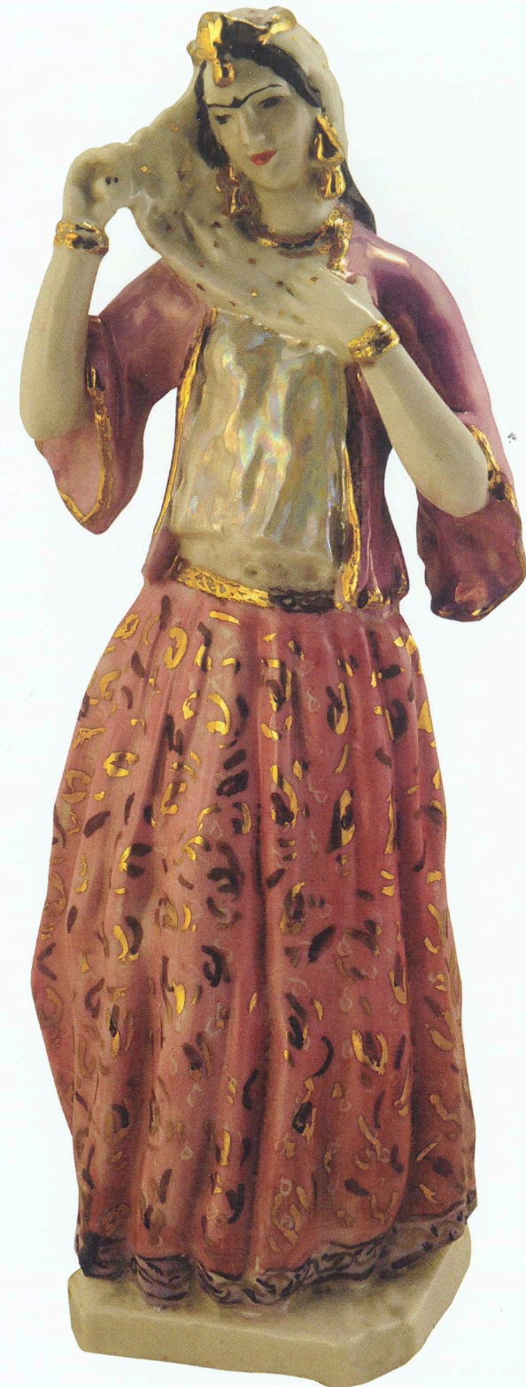
“İran gözəli” (Nizaminin “Yeddi gözəl” poeması əsasında) Çini, şirəüstü naxış, lüst, qızilla zərləmə, 1957 “Beauty of Iran” (based on Nizami’s poem “Seven beauties”) China, ornament of syrup, lust, gilding, 1957