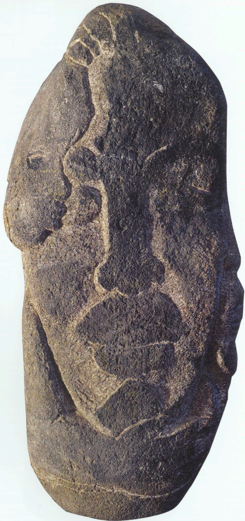
“Ailə” Daş, 1963 “Family” Stone, 1963