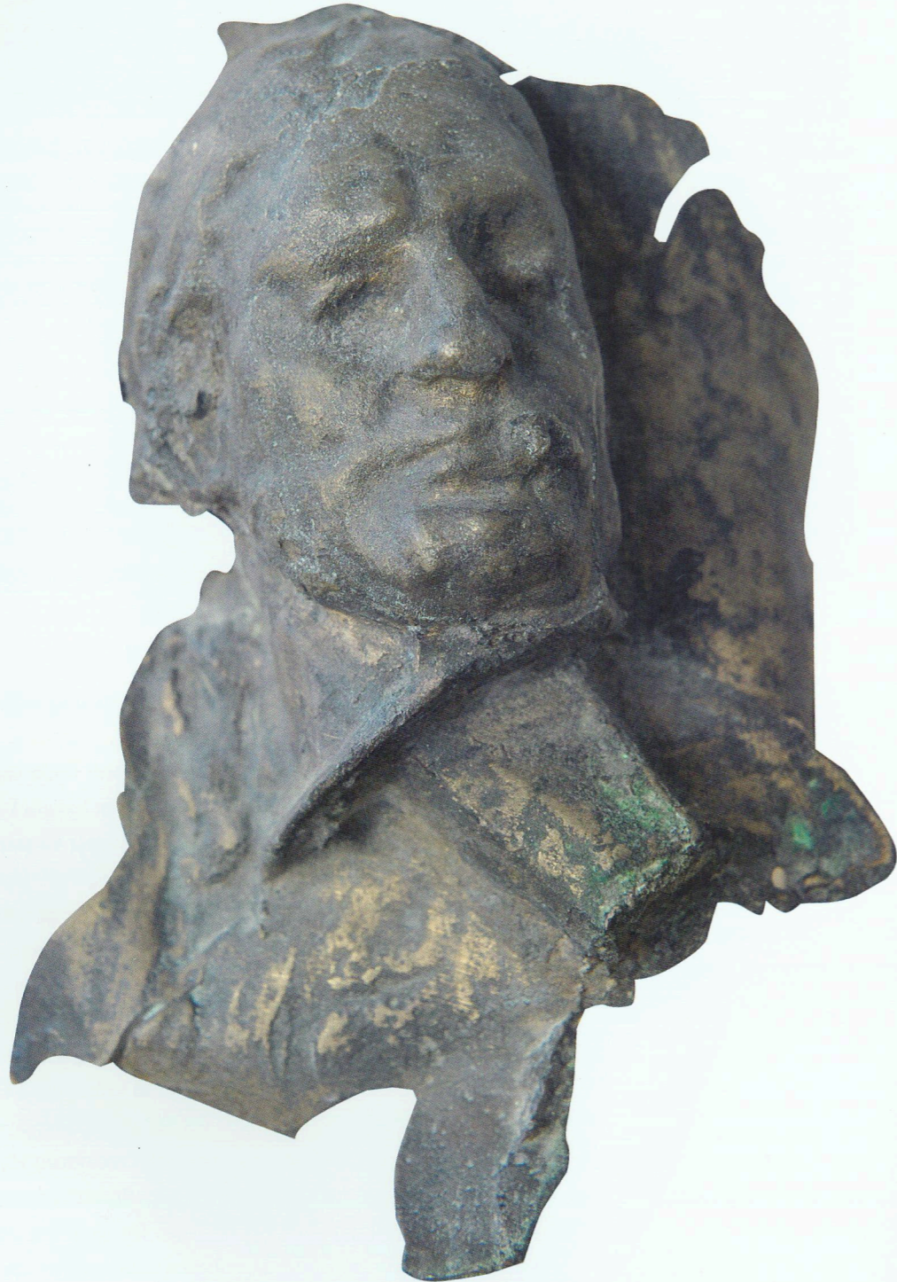
“Kişi portreti” Tunc, 1950-ci illər “Portrait of a man” Bronze, 1950s

Bakının mərkəzində, İçərişəhərdə “yaşayır”, eyni zamanda onun ayrılmaz hissəsidir, insanlar üçün nəzərdə tutulub, heykəltəraşlıq və memarlıq mühitinin ahəngdar sintezinin gözəl nümunəsi kimi çıxış edir. Abidənin xaraktercə kamera heykəli olmasına, təbii çərçivəyə salınmasına baxmayaraq, obraz sərhədlərdən kənara çıxaraq, sanki müəyyən olunmuş formata “sığmır”. Olduqca böyük, kobud ovucalar və yoğun ayaqlar obraza müəyyən ağırlıq və monolitlik verməklə ümumi həcmi “sığışmama” effektini iki dəfə artırır. Küləyin qeyri-real olaraq əydiyi, budaqları uzun qız saçlarını xatırladan ağac gövdələrinin “ağuşunda” əyləşən alimin fiquru heykəltəraş tərəfindən tam kompozisiya məcrasında plastik baxımdan həll edilib. E.Hüseynovanın formalaşdırdığı olduqca lirik obraz ümumi mövzunun qadın tərəfindən dərinlən dərk edilməsinin ifadəsidir. Bu mövzunun açılması heykəltəraşın yaradıcılığında “emosional” elementin gücünü daha çox üzə çıxarır.