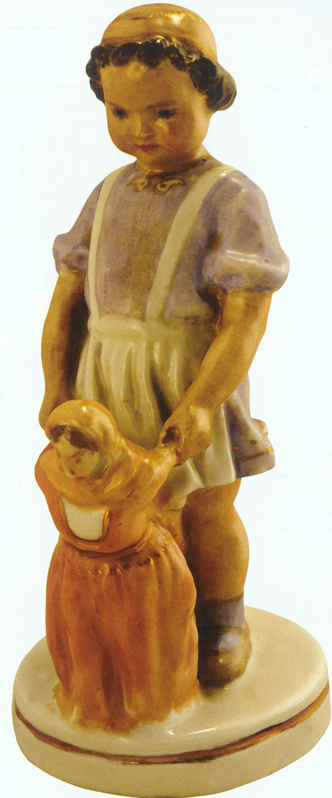
“Qız gəlincik ilə” Dekorativ fiquru Çini, şirəüstü naxış, 1950-ci illər “A girl with a doll” Decorative figure China, ornament over syrup, 1950s