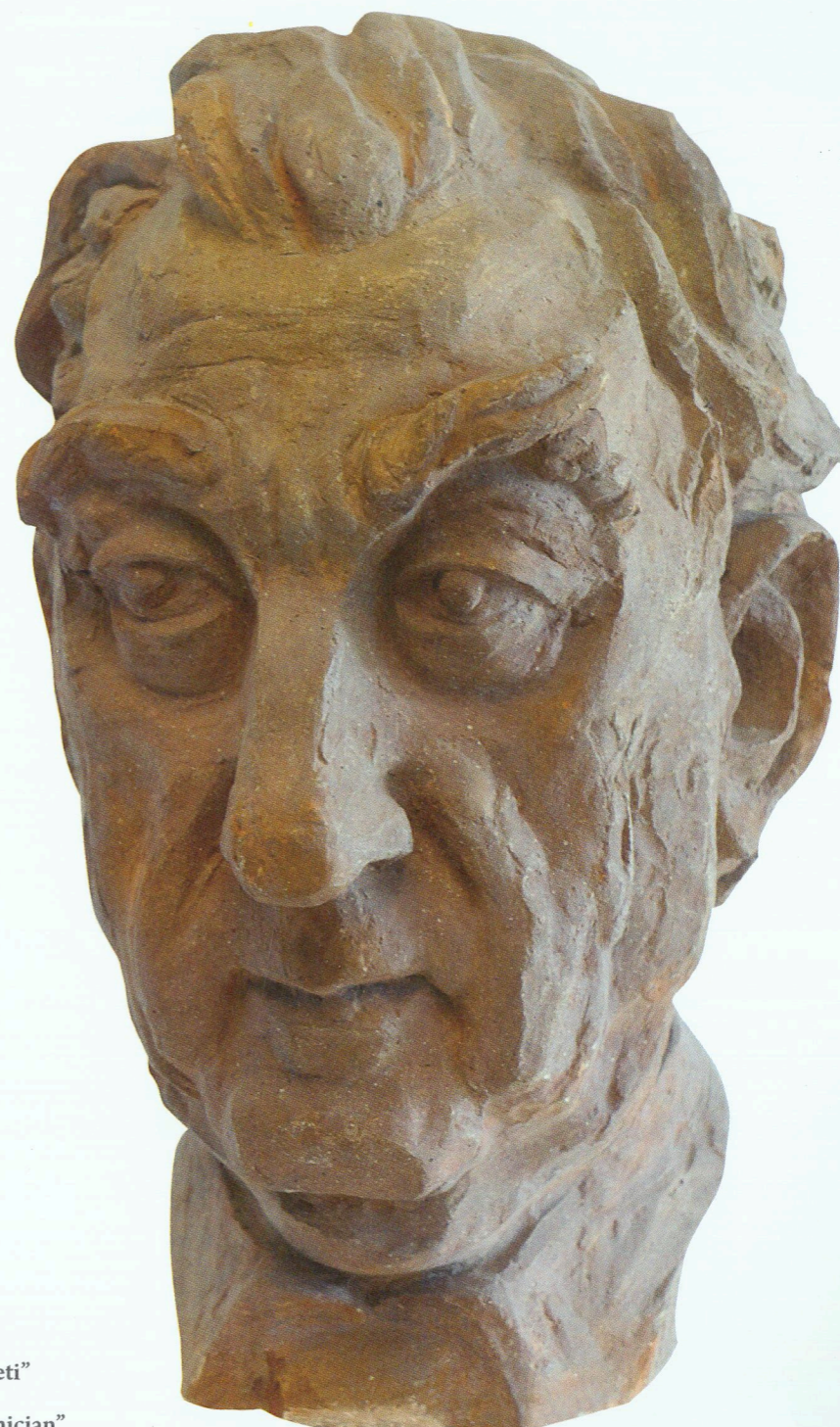
“Akademikin portreti” Gips, 1983 “Portrait of Academician” Plaster cast, 1983