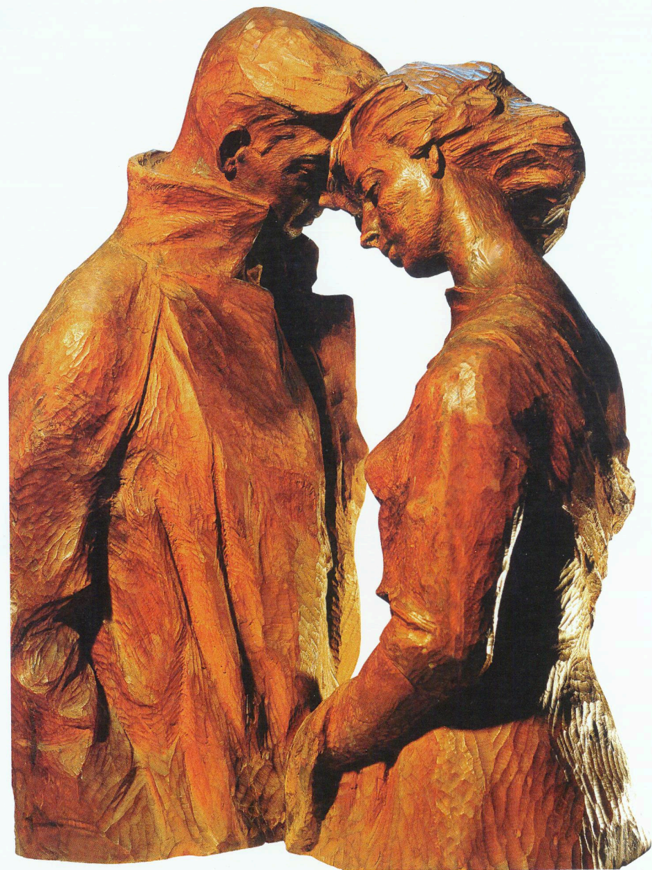
“Sevgililər” Ağac, 1960 “Lovers” Wood, 1960