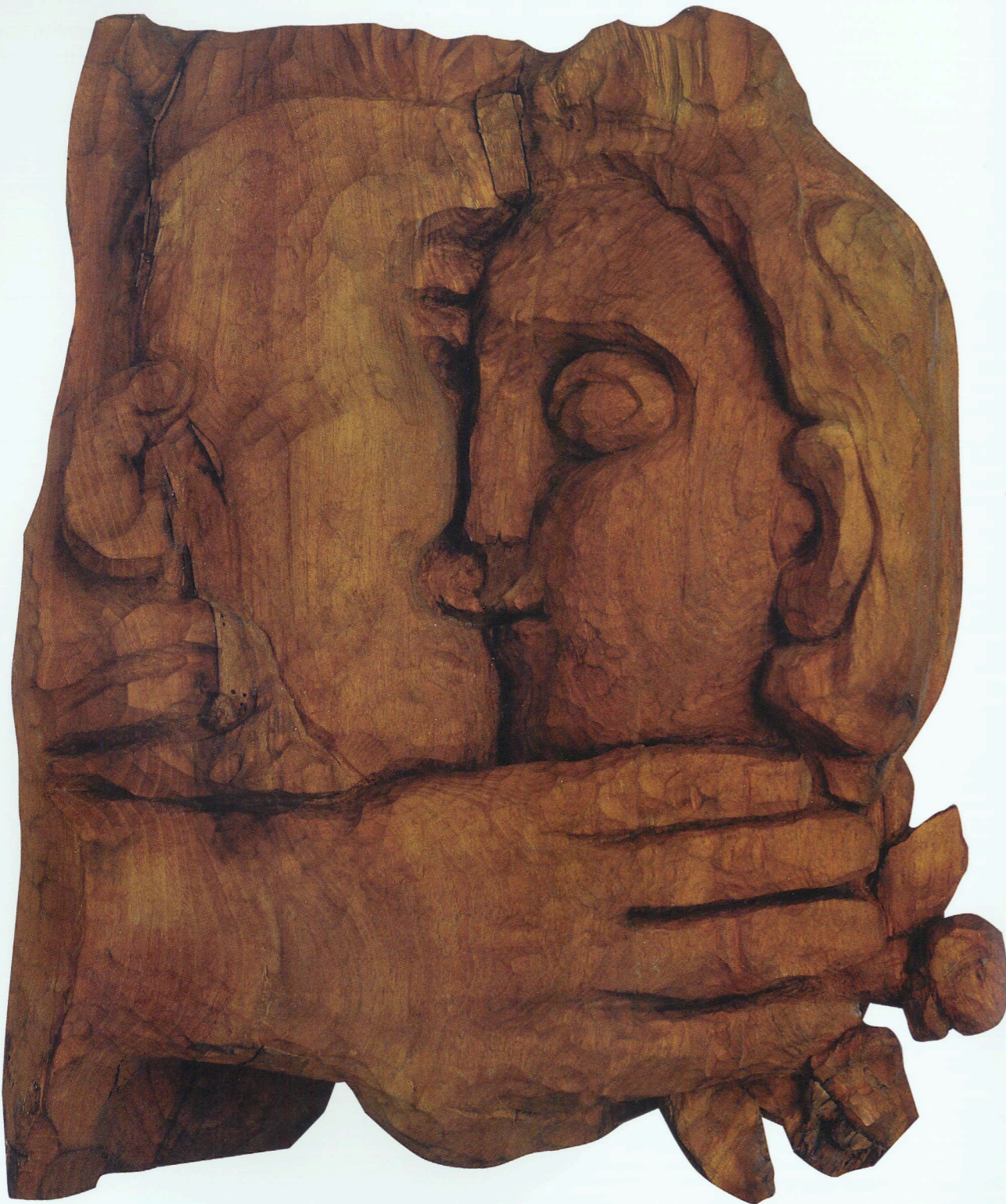
“Ailə” Ağac, 1978 “Family” Wood, 1978

the book might be considered a big success. In the drawing, the poet is surrounded by the major target characters in his satire poems. The contrast between the academically produced drawing of the poet and grotesquely created ones of the characters of his poems brings artistic sharpness and expressiveness to the composition. In addition, the half-titles of illustrations series were developed by the artist for the same edition. His work as an illustrator of the first part of a remarkable poem “Iskandarname” by Nizami Ganjavi can also be considered as important. The book was published on the eve of the 850 th anniversary of the great poet in 1941. As an illustration, I.Akhundov produced seven-page long colorful illustrations depicting significant, according to artist, episodes from the life of the protagonist Alexander the Great.