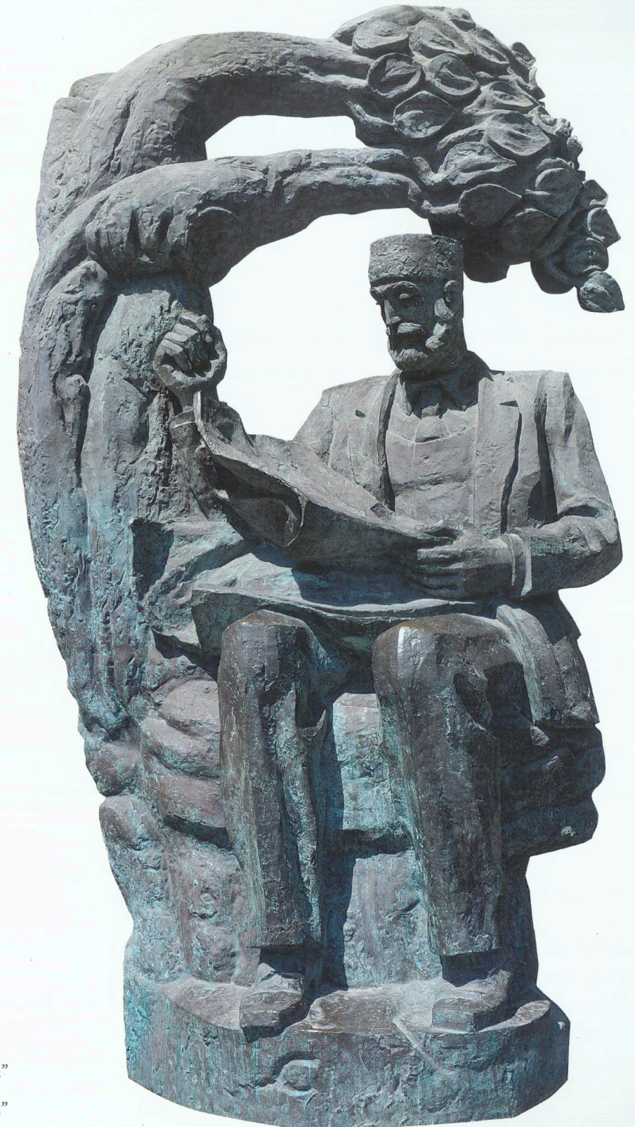
"Həsən bəy Zərdabi" Tunc "Hasan bey Zardabi" Bronze