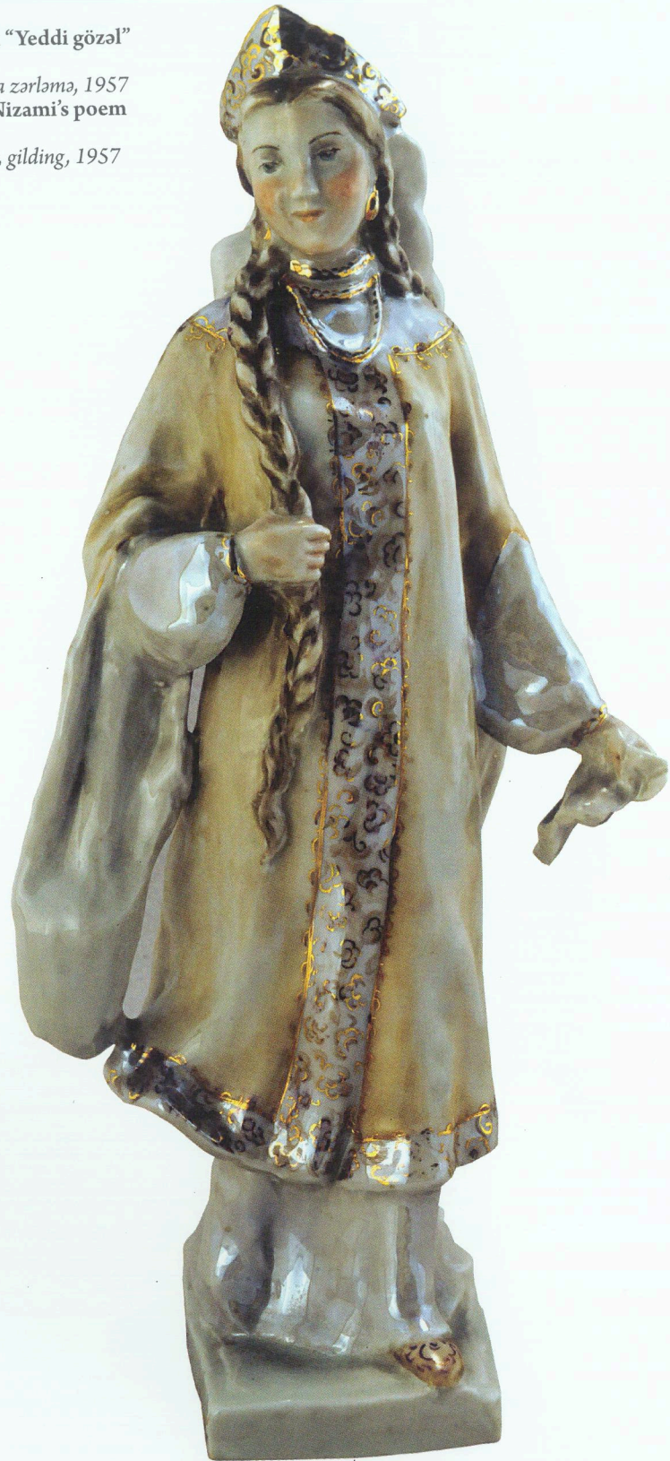
“Slavyan gözəli” (Nizaminin “Yeddi gözəl” poeması əsasında) Çini, şirəüstü naxış, lüst, qızilla zərləmə, 1957 “Slavic Beauty” (based on Nizami’s poem “Seven beauties”) China, ornament of syrup, lust, gilding, 1957