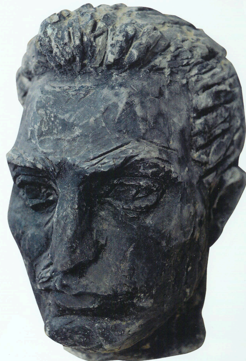
“Kişi portreti” Eskiz Gil, 1965 “Portrait of a man” Sketch Clay, 1965

chosen graphical method. One of the related charming examples is the work done by I.Akhundov on illustrating the poetry collection by the prominent Azerbaijani poet-satirist M.A.Sabir. This collection was issued by the publishing house “Azernashr” in 1934. While working on the book, I.Akhundov did not limit himself to only illustrating it; in fact, he became the organizer for the illustrations of the book by contributing a relevant artistic style. The unshaded drawing of the poet on the frontispiece of