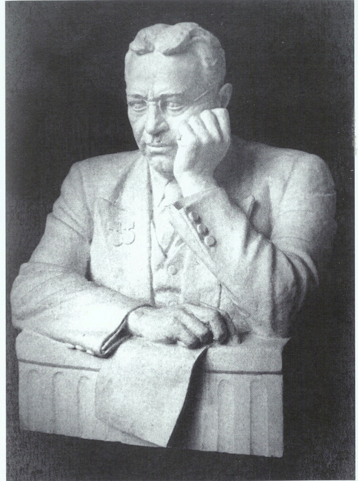
“Üzeyir Hacıbəyli” Gips “Üzeyir Hacıbəyli” Gypsum

Onun ərsəyə gətirdiyi rəssam, şair, musiqiçi və bəstəkarların portretlərindən ibarət qalereya istedadlı qadının bacarıqlı əlləri ilə ifadəli tərzdə yerinə yetirilmiş maraqlı tipaj və xarakterlərdən ibarət geniş ensiklopediyanı xatırladır. Zivər xanımın taleyi elə gətirdi ki, o, Azərbaycan mədəniyyəti tarixində nəinki ilk qadın heykəltəraş, həmçinin