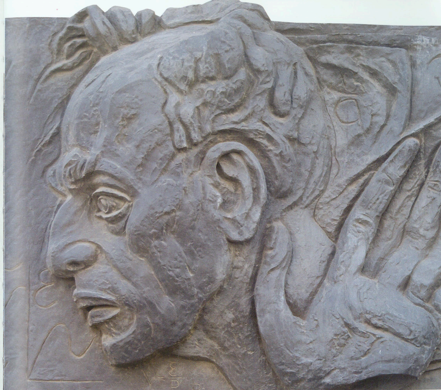
Akademik Lev Landaunun barelyefi Tunc Bás-relief of Academician Lev Landau Bronze