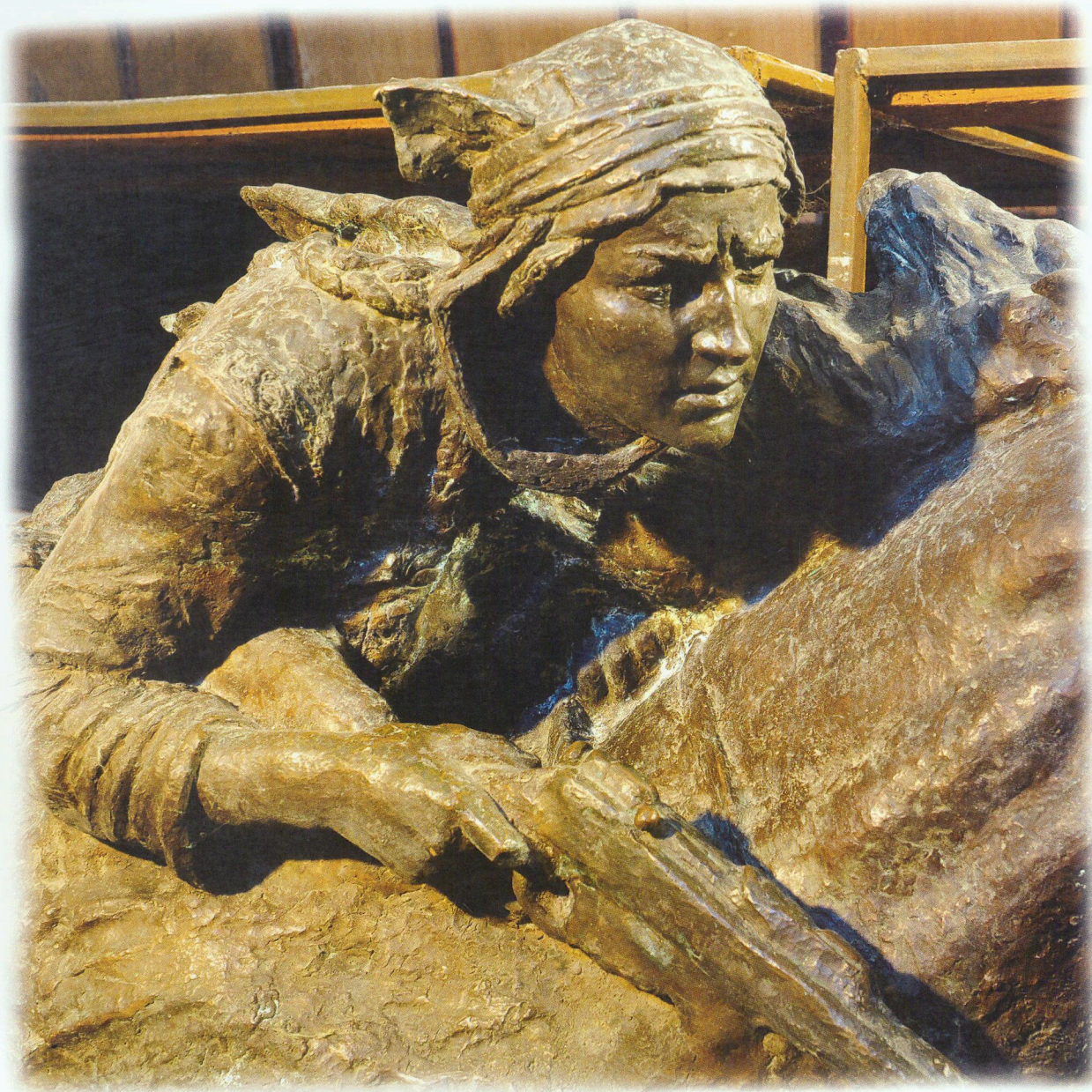
“Həcər” Fragment Tunc, 1958-59 - cu illər “Hajar” Fragment Bronze, 1958-59